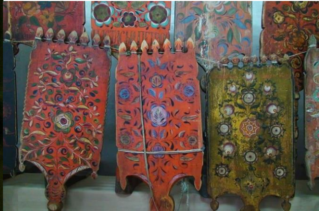
Приложение 2. Пример визуального ряда. Модуль А.