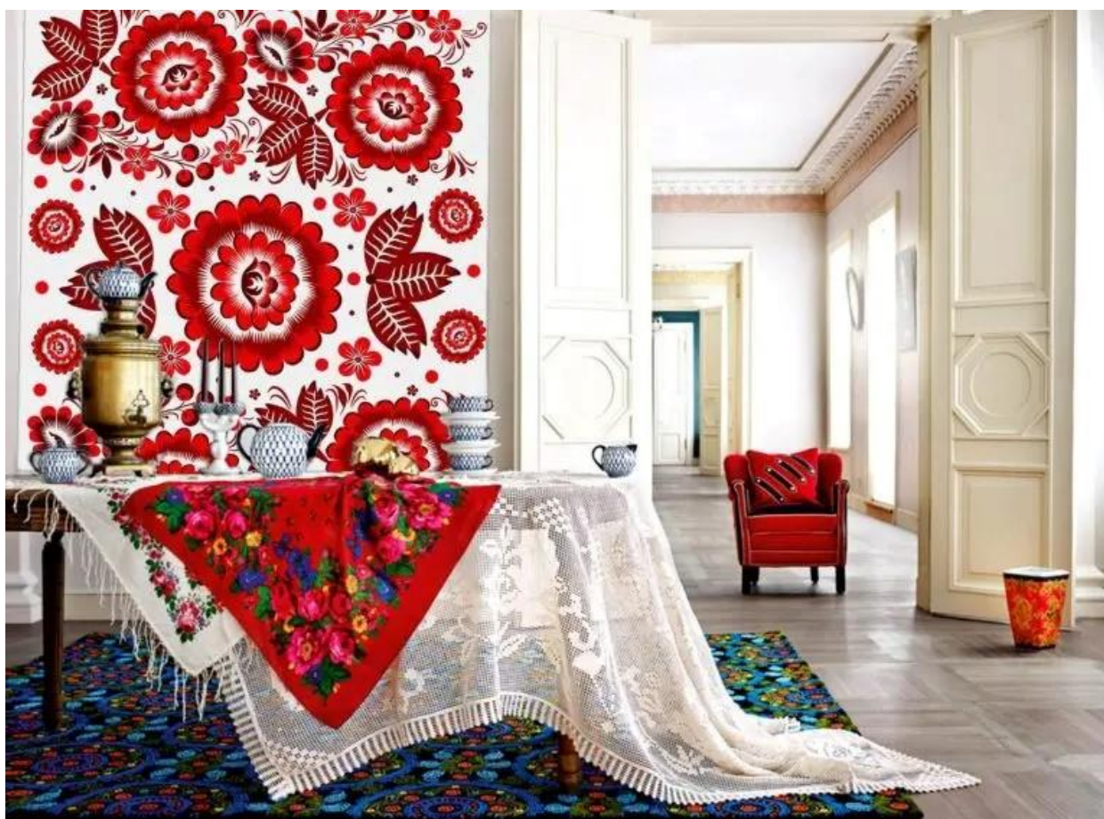
Приложение 1. Вариант интерьера для разработки панно. Модуль А.