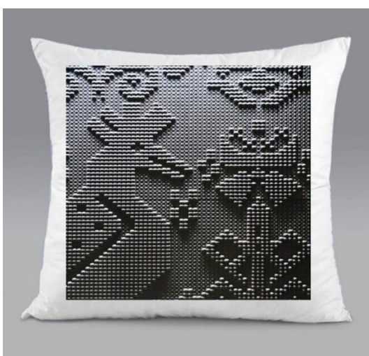
Приложение 6. Пример панно. Модуль В